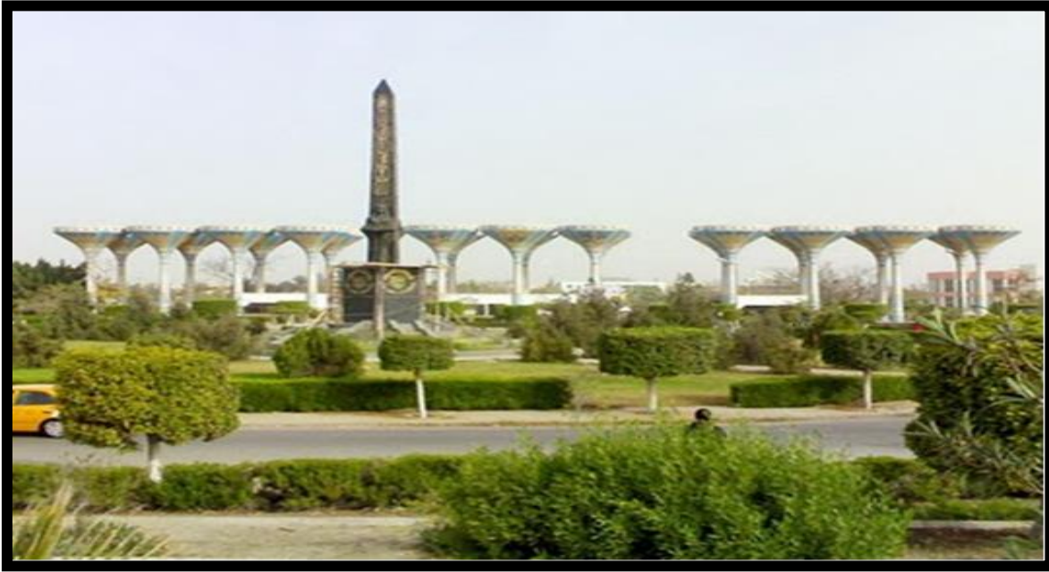
مدخل جامعة قناة السويس بالإسماعيلية