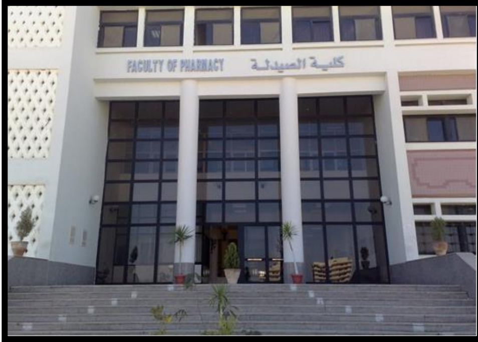
مبنى كلية الصيدلة